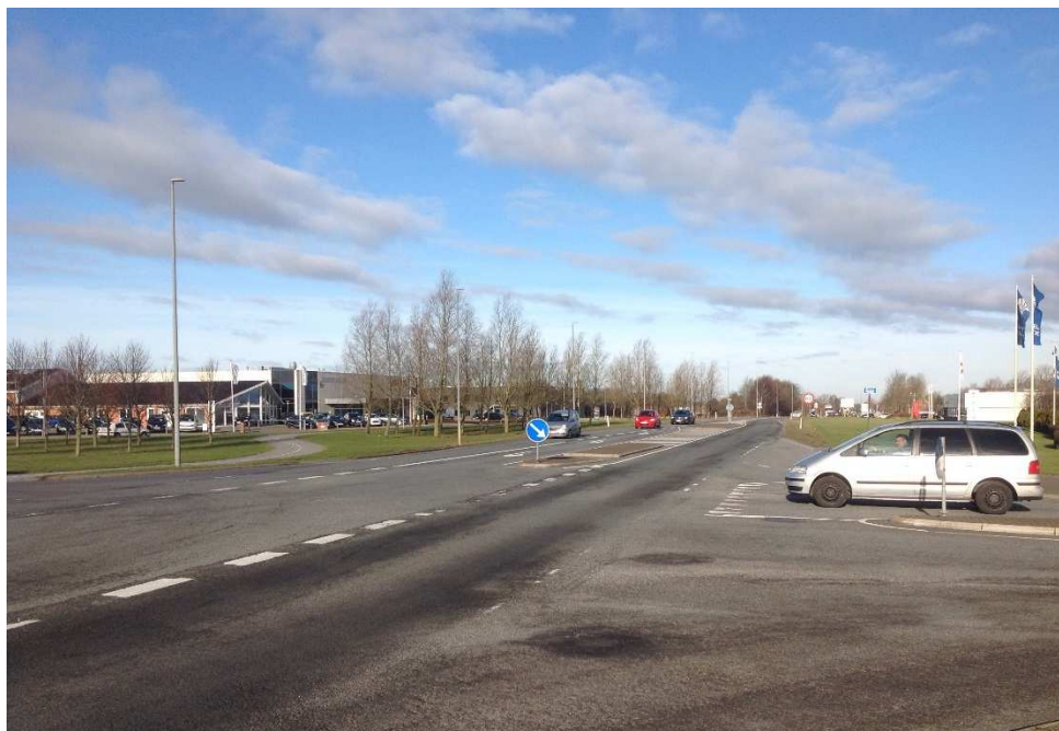
Figur 3 Krydset Ribevej/Jeppe Skovgaards Vej-Tømrervej set mod nord

I perioden 2011-2015 er der registreret tre materielskadeuheld i krydset, som alle skyldes trafikanter fra sidevejene, der ikke overholder deres vigepligt og kører ud i krydset og kolliderer med ligeudkørende på Ribevej. To ud af tre uheld er sket på hverdageftermiddage, og kan således skyldes chancebetonet kørsel fra trafikantene på sidevejene som følge af at det er vanskeligt at komme ud på Ribevej.