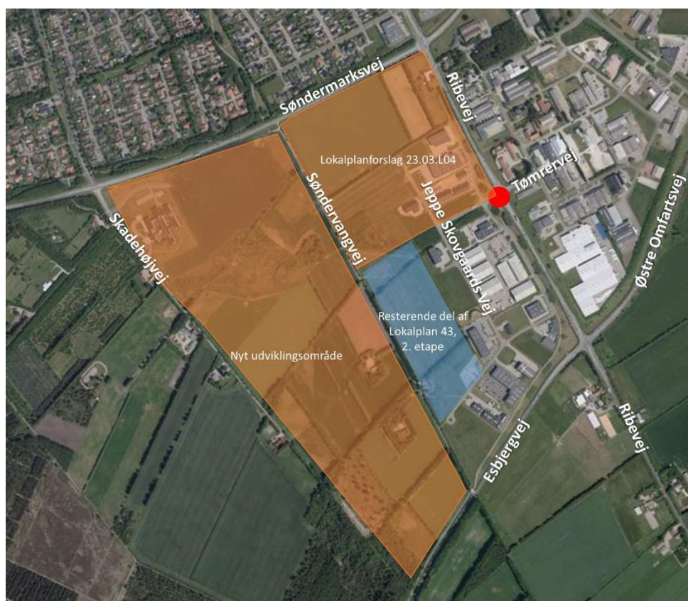
Figur 1 Oversigt over området ved krydset Ribevej/Jeppe Skovgaards Vej-Tømrervej.

I nærværende notat vurderes der derfor ligeledes på hvordan tilkoblingen af lokalplanområdet bedst kan udføres og udformes, herunder krydstyper og placering af kryds samt forhold for lette trafikanter. Dette skal ligeledes ses i relation til de nuværende trafikafviklingsproblemer der er på det omkringliggende vejnet, særligt i perioder af året/døgnet.