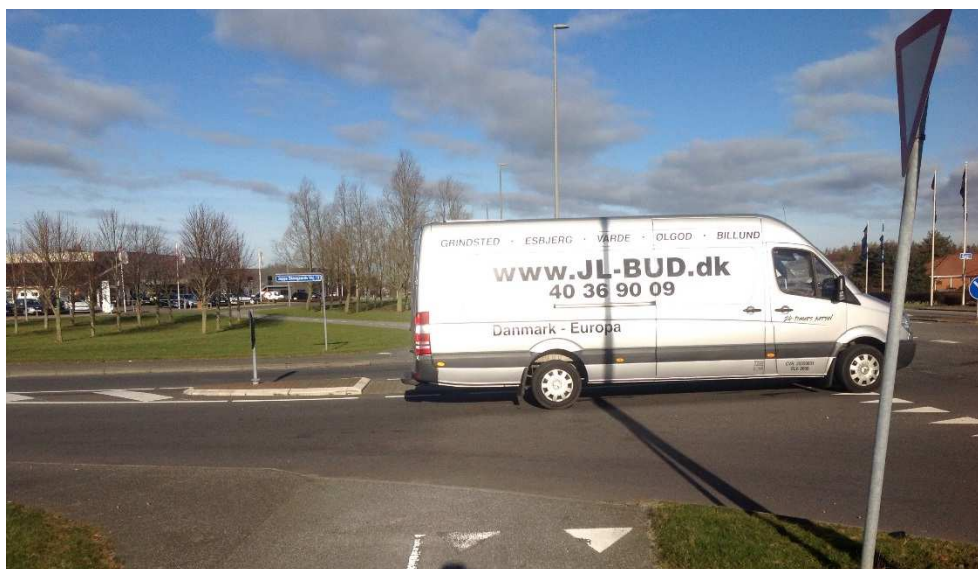
Figur 4 Eksisterende stikrydsning ved dobbeltrettet cykelsti, hvor den afventende trafik på Jeppe Skovgaards Vej blokerer for krydsningen.

Langs den vestlige side af Ribevej er der en dobbeltrettet sti, som krydser Jeppe Skovgaards Vej kun 3 m fra vigelinjen op mod Ribevej. Dette medfører, at en almindelig personbil der holder ved vigelinjen på Jeppe Skovgaards Vej i krydset ved Ribevej, blokerer for stikrydsningen. Denne situation fremgår tydeligt af figur 4.