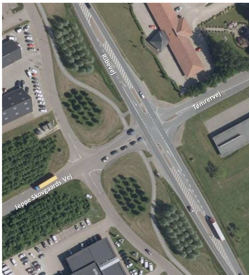
Figur 2 Krydset Ribevej/Jeppe Skovgaards Vej-Tømrervej.

Krydset er på nuværende tidspunkt et vigepligtsreguleret F-kryds beliggende uden for byzonen med en lokal hastighedsbegrænsning på 60 km/t på Ribevej. Der er venstresvingsbaner på Ribevej og en dobbeltrettet cykelsti langs den vestlige side af vejen. Umiddelbart efter krydset er der buslommer på Ribevej mod hhv. nord og syd.